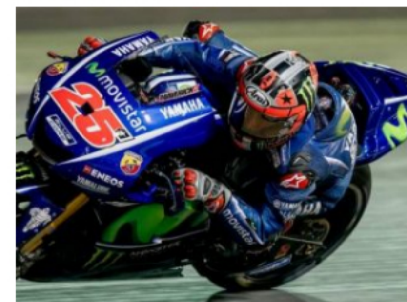
MotoGp 2017, Qatar: la pagella del Dicos