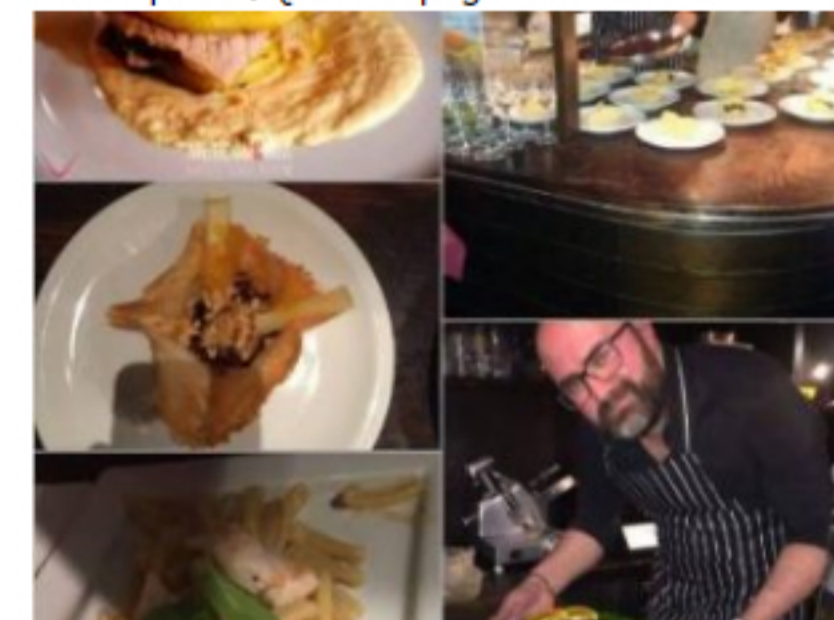
Innovazione, amore, creatività e passione: a Napoli, la cucina dello Chef Bellezzamia