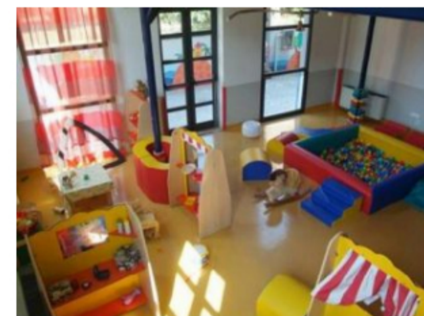
Fiumicino, arrestata maestra della scuola materna comunale